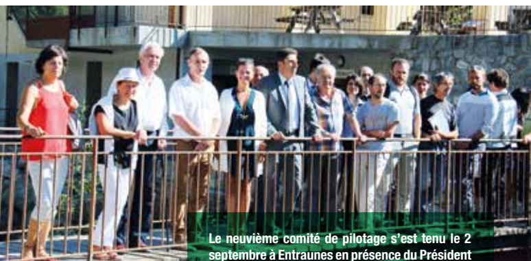
Le neuvième comité de pilotage s'est tenu le 2 septembre à Entraunes en présence du Président de la Communauté de Communes Alpes d'Azur et de la Sous-Préfète Nice Montagne.

Le comité de pilotage du site des Entraunes s'est réuni en septembre et la Communauté de Communes Alpes d'Azur a été reconduite dans son rôle de structure animatrice des sites pour les trois prochaines années.