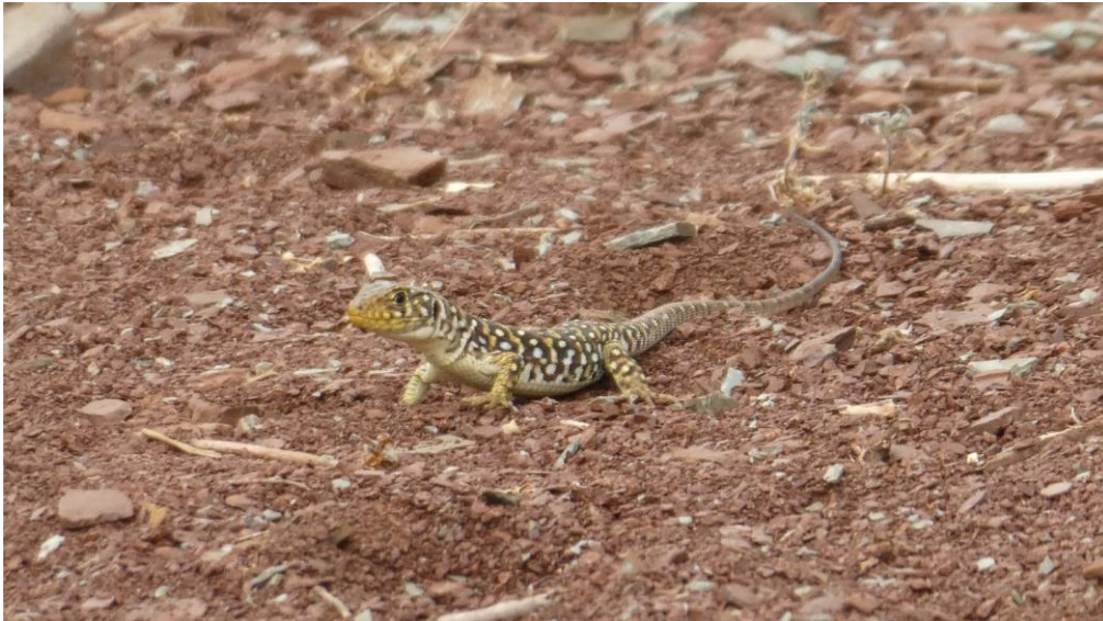
Lézard ocellé juvénile à l'affût des insectes pour se nourrir – 2017- © C. Lemarchand

Au moins 5 mailles sont occupées par le Lézard ocellé entre le pont de Berthéou et la balise 7a qui indique le point sublime. Et l'espèce a également été relevée dans au moins trois mailles près de la route menant à Villeplane. Soit au moins 4 couples ont été observés sur la RNR. Les Lézards ocellés de la réserve utilisent principalement comme gîte les pierres blanches (grès) le long du chemin de randonnée ou celles tombées de plus haut et posées dans les pentes. Certains utilisent également les murets de pierre construits par l'homme pour le maintien de la route de Villeplane. Un seul a été vu utilisant une grosse pierre rouge (pélite) pour se réfugier.