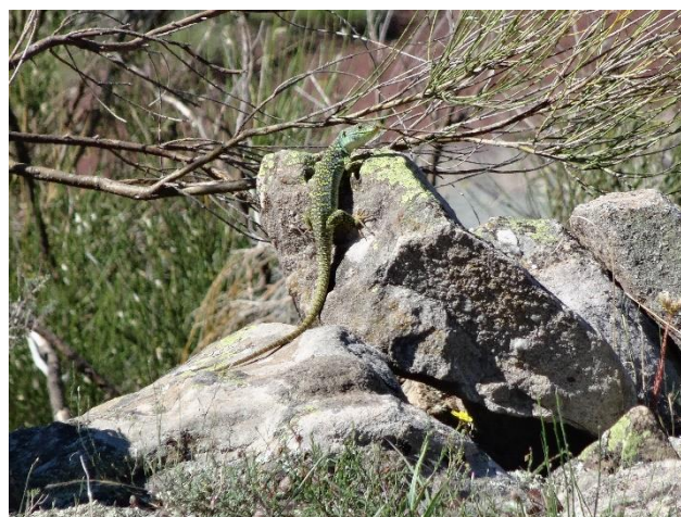
Lézards ocellés, Timon lepidus , observés dans le RNR des gorges de Daluis en 2014