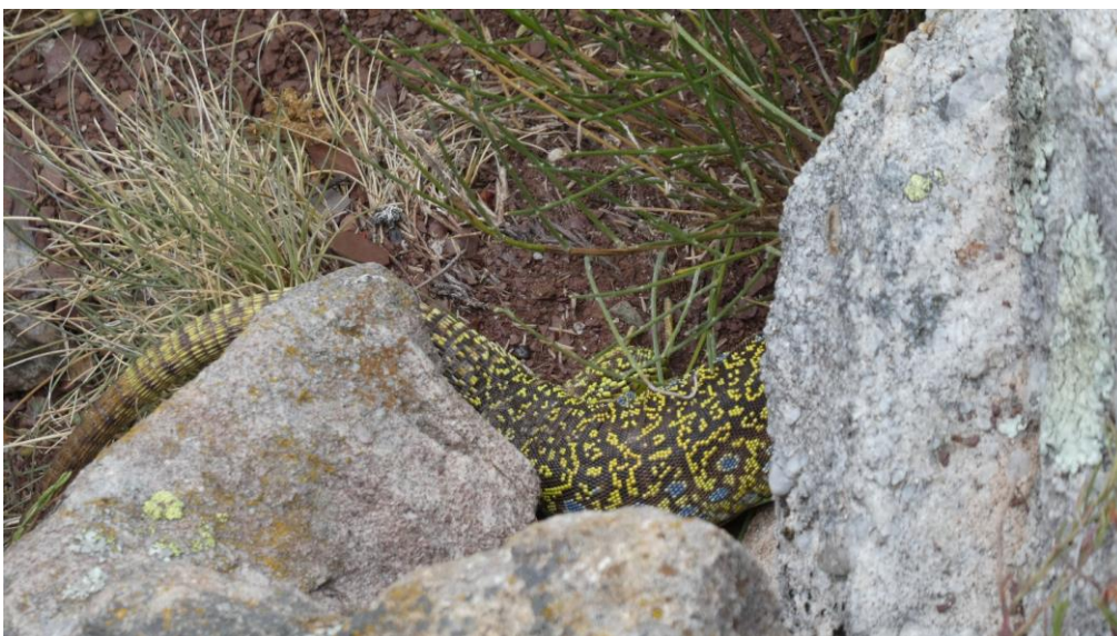
Lézard ocellé adulte se croyant bien caché à l'abri d'une pierre – 2017