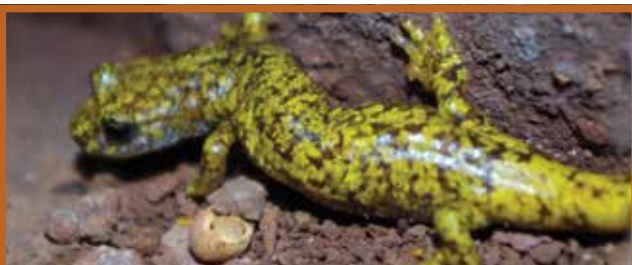
Le Spéléropès de Strinati

Les gorges de Daluis sont un lieu de rencontre entre des espèces typiquement alpines comme le chamois, le tétras lyre ou encore l'aigle royal et des espèces méditerranéennes telles le lézard ocellé ou le circaète Jean-le-Blanc. Cette cohabitation singulière inclut également plusieurs espèces endémiques, notamment 2 escargots, le Maillot et la Marbrée des pélites, symbole de la Réserve et un petit amphibien, le spéléropès de Strinati.