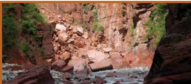
Le Var au fond des gorges de Daluis

Les gorges de Daluis, creusées dans les pélites rouges du Permien, offrent un paysage aussi spectaculaire qu'insolite aux allures de canyons, d'où son surnom de « petit Colorado niçois ».