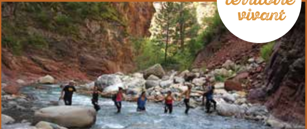
L'aqua randonnée

Cet espace protégé accueille le pastoralisme, la chasse ou encore la pêche. Concilier les différentes pratiques et gérer la fréquentation sont ainsi des priorités sur ce site où de nombreuses activités de pleine nature se rencontrent : randonnée pédestre, VTT, canyoning, rafting... Au sein de la Réserve, les acteurs du territoire travaillent ensemble pour maintenir cet équilibre fragile entre l'Homme et la Nature et sensibiliser à l'importance de préserver notre patrimoine naturel.