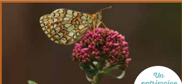
La Mélitée des linaires

La pélite est une roche friable, retenant peu de nutriments et d'eau, la flore qui s'y développe est majoritairement composée de genêts, de buis, de thym, de genévriers, espèces caractéristiques des milieux de landes. Les plantes s'adaptent à cette roche particulière mais aussi à la verticalité du site, comme la saxifrage à feuilles en languettes.