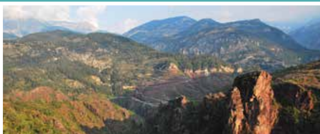
Le panorama des gorges de Daluis

La pélite est une roche sédimentaire déposée à la fin de l'ère Primaire, il y a 270 millions d'années dans un immense rift sous un climat tropical humide. Elle doit sa couleur « lie de vin » à l'oxydation du fer qu'elle contient. Ces roches rouges contrastent avec la barre calcaire qui la recouvre et notamment le quartzite très blanc du Trias. Ce contact représente une crise géologique majeure de l'histoire de la Terre.