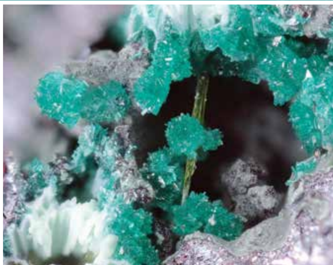
La Gilmarite

La Réserve des gorges de Daluis possède plus de 70 espèces de minéraux recensées dans les différentes galeries du site. Certaines ont été découvertes pour la première fois ici, comme la Barrotite ou la Gilmarite. Plusieurs de ces galeries étaient exploitées au 19 ème siècle notamment pour le cuivre.