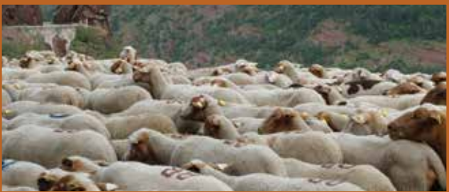
La transhumance dans les gorges

Cet espace protégé accueille le pastoralisme, la chasse ou encore la pêche. Concilier les différentes pratiques et gérer la fréquentation sont ainsi des priorités sur ce site où de nombreuses activités de pleine nature se rencontrent : randonnée pédestre, VTT, canyoning, rafting... Au sein de la Réserve, les acteurs du territoire travaillent ensemble pour maintenir cet équilibre fragile entre l'Homme et la Nature et sensibiliser à l'importance de préserver notre patrimoine naturel.