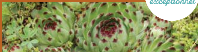
La Joubarbe